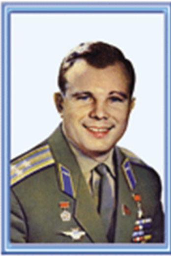
ГАГАРИН ЮРИЙ АЛЕКСЕЕВИЧ

1961 елның 12 апрель көнне безнең ил гражданын хәрби очучы Юрий Алексеевич Гагарин галәмгә очты. Аның «Восток» корапле Жир шарын тирәли 108 минута әйләнеп чыкты һәм туган жиренә исән-имин әйләнеп кайтты.